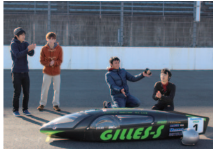
こちらも強豪、Team BIZONが2番手に。