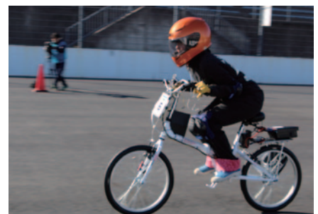
KV-BIKEクラス2の初代王者は飯田OIDE長姫高校課題研究A組。