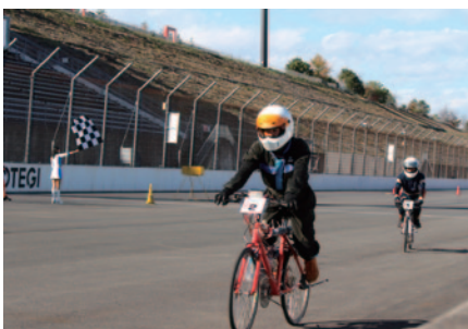
もてぎ初開催のKV-BIKE。鈴鹿では2014年から開催されています。

初開催となったKV-BIKEは、クラス1が2台、クラス2が6台の参加。クラス1は小野塚レーシング(orz)が、クラス2は飯田OIDE長姫高校課題研究A組が、初のもてぎ大会の覇者となりました。