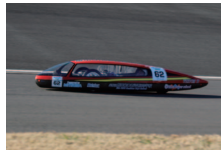
KV-2クラス3連覇を果たした飯田OIDE長姫高校。