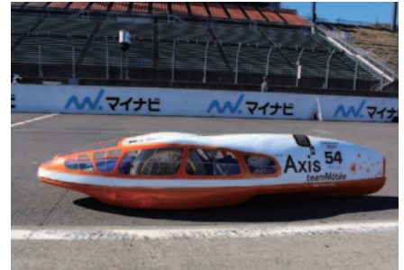
初出場のteam MotosがKV-2クラストップタイム。