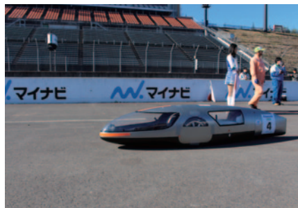
「e-kiden 90分ロングディスタンス」を制し、総合優勝のZDP。