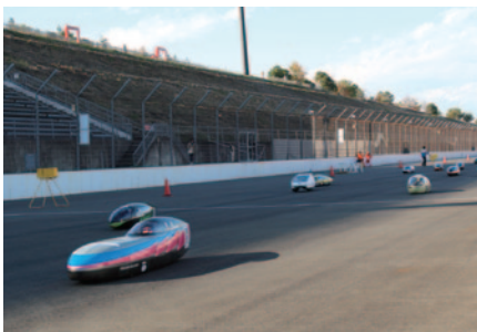
「e-kiden 90分ロングディスタンス」スタートシーン

KV-1クラスは7番手スタートのZDPが29周を記録して優勝。2位に入ったTeam BIZONと同ポイントながら、この競技が優先されるため、総合初優勝を果たしました。KV-2クラスは飯田OIDE長姫高校が逆転で3連覇を果たしました。